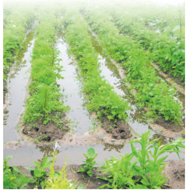
Фота носьце ілюстрацыйны характар.

– Быў на месцы, размаўляў з людзьмі. Там ёсць ужо існуючыя канавы, праз якія мы плануем ажыццяўляць адвядзенне вады. Праз завулак пракладзём трубу, частку агародаў афіцыйна забяром у людзей – гэта 2, максімум 3 метры, там у іх няма градак, адно «балота», – папярэдня дамоўленасць з уладальнікамі зямельных участкаў ужо дасягнутая – і камунальнікі зробіць нармальныя вадасцёкавыя канавы. Па іх вада будзе сыходзіць з агародаў у трубу і далей – у цэнтральны вадасцёк. Такое рашэнне мы прапанавалі людзям, і яны яго ў цэлым адобрылі. У найбліжэйшы час правядзём сход жыхароў, каб дакументальна замацаваць гэта рашэнне.